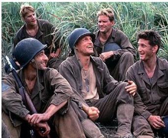
1998 LA LIGNE ROUGE (The thin red Line) de T. Malick avec Woody Harrelson, Sean Penn