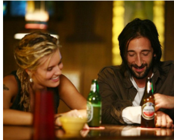
2010 THE EXPERIMENT (The Experiment) de Paul Scheuring avec Maggie Grace