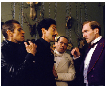
2014 THE GRAND BUDAPEST HOTEL de Wes Anderson avec W. Dafoe, M. Amalric, R. Fiennes