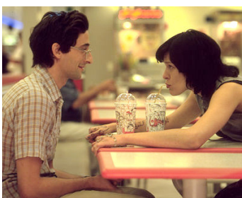
2002 DUMMY (Dummy) de Greg Pritikin avec Milla Jovovich