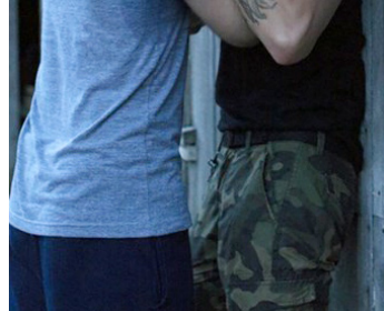
2014 BRAQUAGE À L'AMÉRICAIN (American Heist) de Sarik Andreasyan avec Hayden Christensen