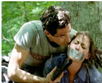
1999 OXYGEN (Oxygen) de Richard Shepard avec Maura Tierney