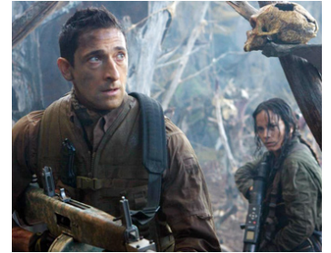
2010 PREDATORS (Predators) de Nimrod Antal avec Alice Braga