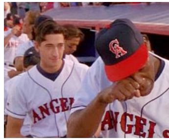
1994 UNE ÉQUIPE AUX ANGES (Angels of the Outfield) de William Dear avec Danny Glover