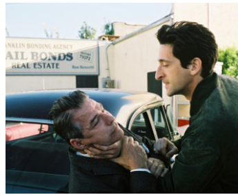
2006 HOLLYWOOD (Truth, Justice and the American Way) d'Allen Coulter avec Kevin Hare