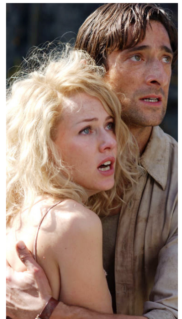
2005 KING KONG (King Kong) de Peter Jackson avec Naomi Watts