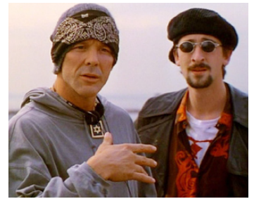
1996 BULLET (Bullet) de Julien Temple avec Mickey Rourke