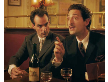
2011 MINUIT À PARIS (Midnight in Paris) de Woody Allen avec Tom Hiddleston