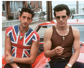
1999 SUMMER OF SAM (Summer of Sam) de Spike Lee avec John Leguizamo