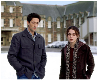
2005 THE JACKET (The Jacket) de John Maybury avec Keira Knightley