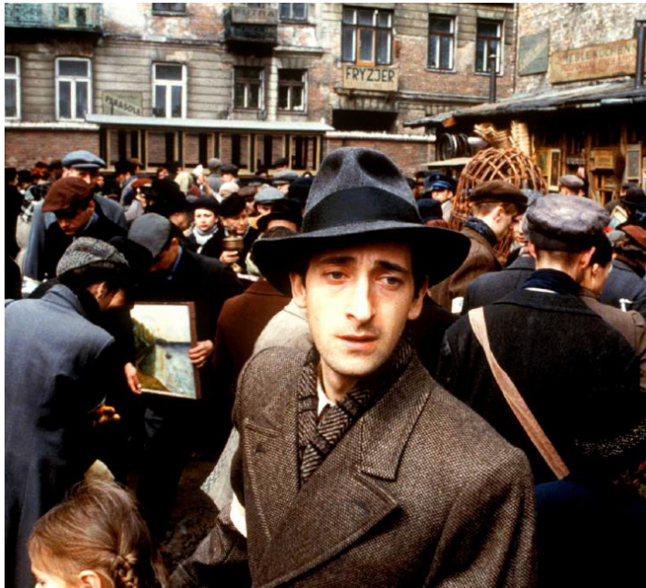
2002 LE PIANISTE (The Pianist) de Roman Polanski