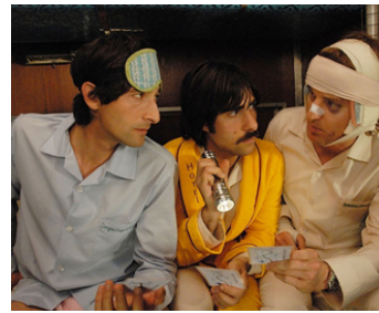
2007 À BORD DU DARJEELING LIMITED de Wes Anderson avec J. Schwartzman, Owen Wilson