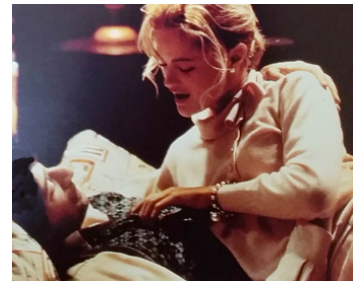
1999 LIBERTY HEIGHTS (Liberty Heights) de Barry Levinson avec Carolyn Murphy