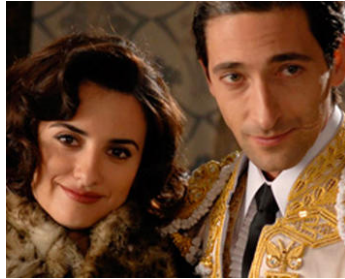
2010 MANOLETE (Manolete) de Menno Meyies avec Penelope Cruz