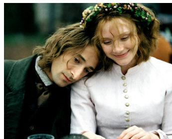
2004 LE VILLAGE (The Village) de M. Night Shyamalan avec Bryce Dallas Howard