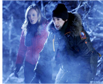
2010 SPLICE (Splice) de Vincenzo Natali avec Sarah Polley