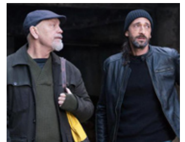
2017 BULLET HEAD (Bullet Head) de Paul Solet avec John Malkovich