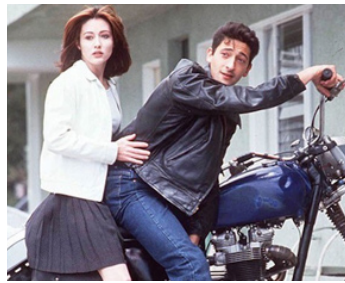
1994 REBEL HIGHWAY (Jailbreakers) de William Friedkin avec Shannen Doherty