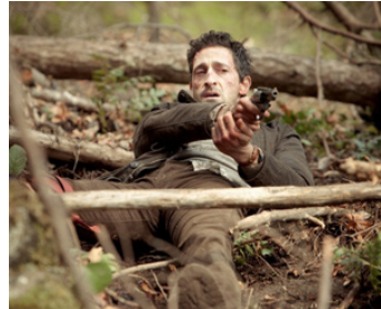
2011 LOST IDENTITY (Wrecked) de Michael Greenspan