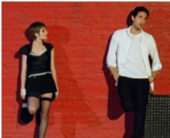
2011 LE DÉTACHEMENT (Detachment) de Tony Kaye avec Sami Gayle