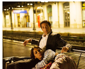
2014 PUZZLE (Third Person) de Paul Haggis avec Moran Atlas