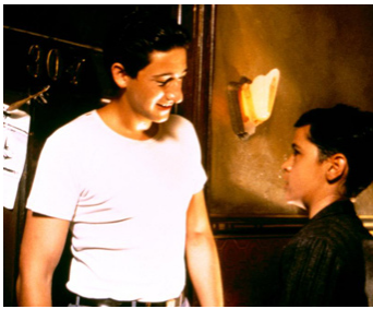
1992 KING OF THE HILL (King of the Hill) de Steven Soderbergh avec Jesse Bradford