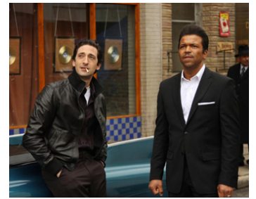
2008 CADILLAC RECORDS (Cadillac Records) de Darnell Martin avec Jeffrey Wright