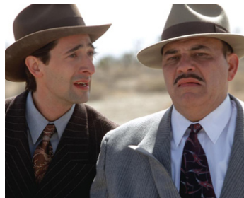
2003 THE SINGING DETECTIVE (The Singing Detective) de Keith Gordon avec Jon Polito