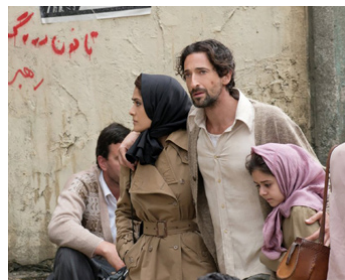
2016 INSURRECTION (Septembers of Shiraz) de Wayne Blair avec Salma Hayek