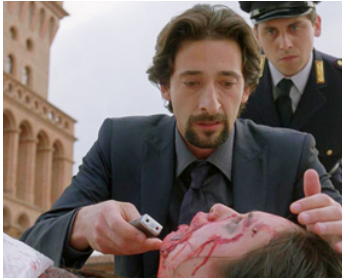
2010 GIALLO (Giallo) de Dario Argento de Andrea Redavid