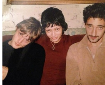
1997 SOUS INFLUENCES (6 Ways to Sunday) d'Adam Bernstein avec Norman Reedus, Daryl Dixon