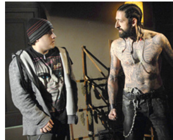
2012 BACK TO 1942 (Yi Jiu Si Er) de Feng Xiaogang