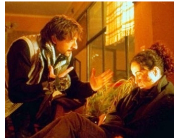
2000 HARRISON'S FLOWERS d'Étie Chouraqui avec Andie MacDowell