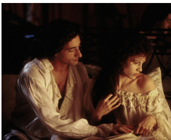
2001 L'AFFAIRE DU COLLIER (The Affair of the Necklace) de Charles Shyer avec Hilary Swank