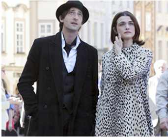
2009 UNE ARNAQUE PRESQUE PARFAITE (The Brothers Bloom) de Rian Johnson avec R. Weisz