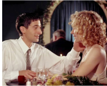
1997 J'AI ÉPOUSÉ UN CROQUE-MORT (The Understaker's Wedding) de John Bradshaw